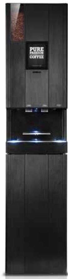
CQube LF13 Touch Screen med underskåp